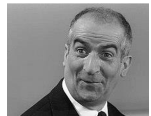
Louis de Funès (1914-1983)